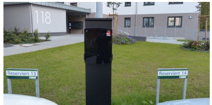
Eine der drei Ladesäulen für die Elektrofahrzeuge, die demnächst im Quartier Nauborner Straße für moderne und bequeme Mobilität sorgen werden.

„Mit dem Pilotprojekt zeigt die Gewobau, dass nachhaltiges Wohnen und moderne Mobilität Hand in Hand gehen. Das Interesse der Mietparteien ist groß. Wir sind überzeugt, dass dieses Modell Zukunft hat – für mehr Klimaschutz, bessere Mobilität und modernen Komfort im Quartier“, unterstreicht Jörg Unützer.